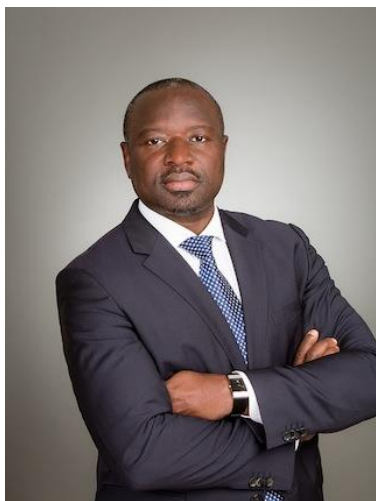
Dr. Lassina Zerbo

ゼルボ事務局長によれば、「世界全体で言えば、男女間の真の平等を達成するにはまだまだ時間がかかる。数年前からの格差の縮小度合いは、予想に比して小さい。2015年の世界経済フォーラムは、ジェンダー格差を完全に解消するには2133年までかかると予測した。」と語った。